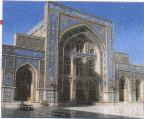
VERI TESORI A sinistra, la Moschea del Venerdì, risalente al 1200. Herat (a destra) si trova nella zona occidentale dell'Afghanistan.